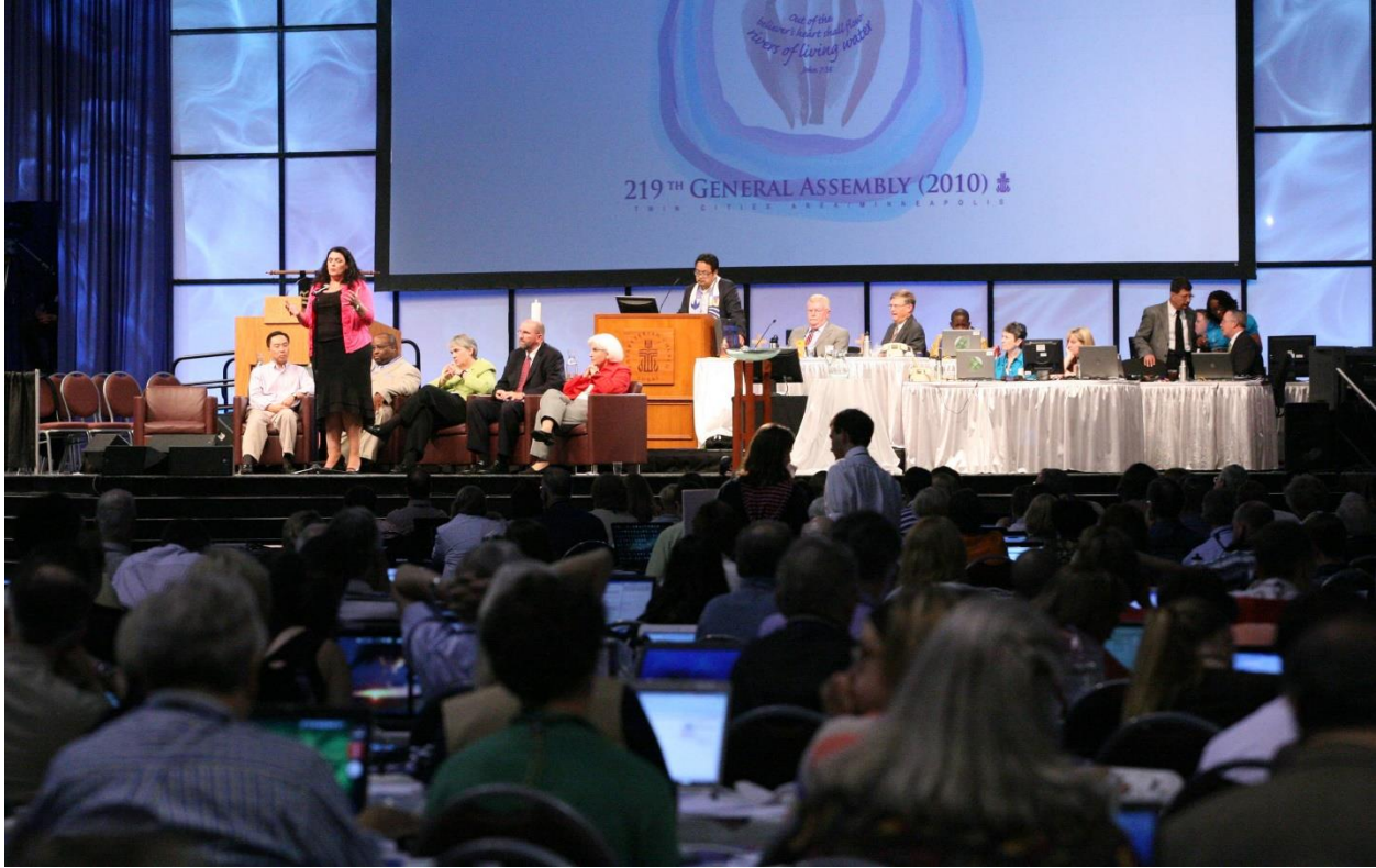
총회의 무대와 회의장