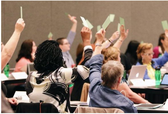
총대들은 총회 위원회에서 그리고 전체 회의에서 발언권과 투표권을 갖습니다.