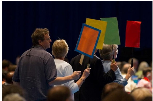
총대들은 또한 동의를 하고 개정안을 헌의할 수 있습니다.

지난 100 년 동안 총회는 회의에 발언과 지혜를 제공할 수 있도록 다른 사람들을 초대하는 지혜를 보았습니다. 자문대표는 총회의 상설 규칙에 따라 "총회가 그들의 특별한 견해를 인식하고 들을 수 있도록 회의에 참석한다"고 합니다. [ Standing Rule B.2.a ].