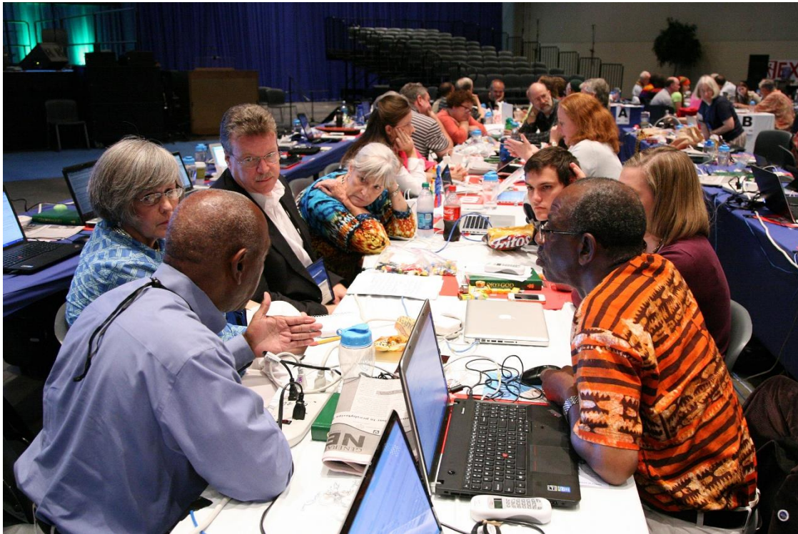
총회 본회의의 기간 중 사업을 논의하는 총대들.

각 총회는 15 명의 에큐메니칼 자문대표 (EAD) 들을 초대하여 우리나라의 교회와 전 세계 교회의 차기 총회에 참석합니다.