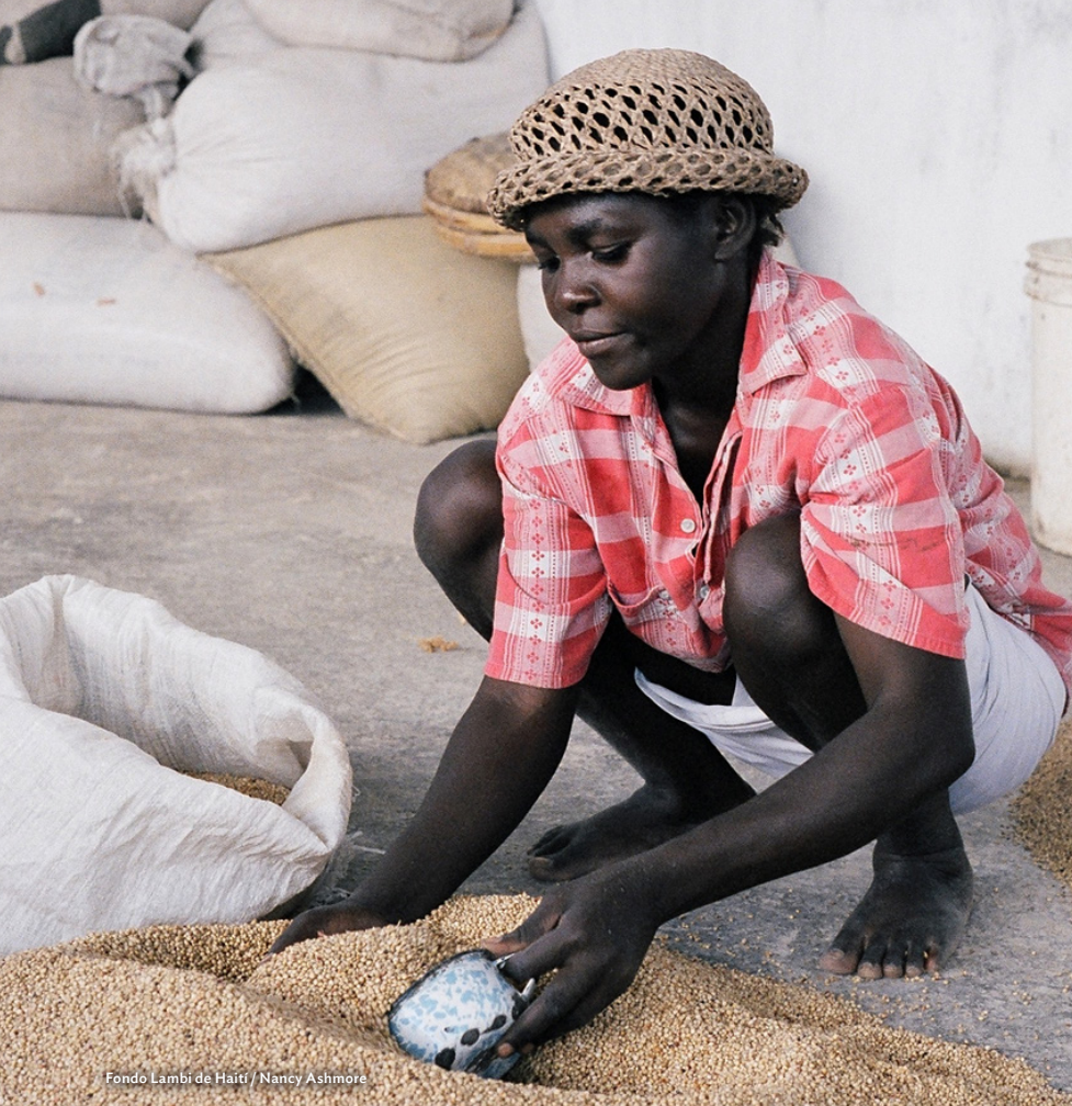
Fondo Lambi de Haití / Nancy Ashmore