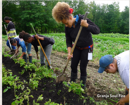
Granja Soul Fire

Alrededor de 23 millones de estadounidenses viven actualmente en desiertos alimentarios con escaso o nulo acceso a alimentos frescos y asequibles. Usted puede ayudar apoyando una iniciativa de huertos comunitarios que suministran productos nutritivos donde más se necesitan y contribuyen a mejorar la salud.