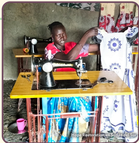
Hope Restoration en Sudán del Sur